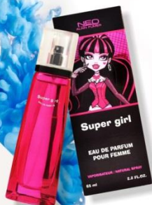
SUPER GIRL жидкая парфюмерная вода 65 ml цветочный, фруктовый