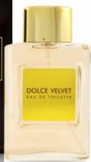
DOLCE VELVET мужская парфюмерная вода 100 ml Кожаный