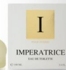
IMPERATRICE EAU DE TOILETTE 100 ml цветочный, фруктовый