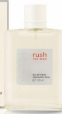
DUCCE RUSH мужская парфюмерная вода 100 ml Сладковатый апельсиновый