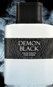
DEMON BLACK мужская парфюмерная вода 100 ml Сладковатый апельсиновый