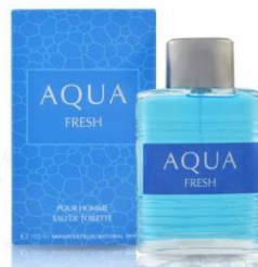
AQUA FRESH мужская парфюмерная вода 100 ml