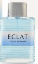
ECLAT мужская парфюмерная вода 100 ml Сладковатый апельсиновый