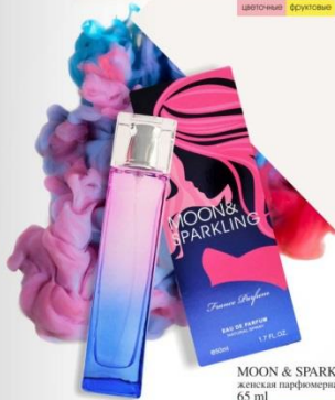
MOON & SPARKLING жидкая парфюмерная вода 65 ml цветочный, фруктовый