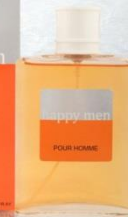
HAPPY MEN мужская парфюмерная вода 100 ml Ароматические: Фруктовый, Цитрусовый