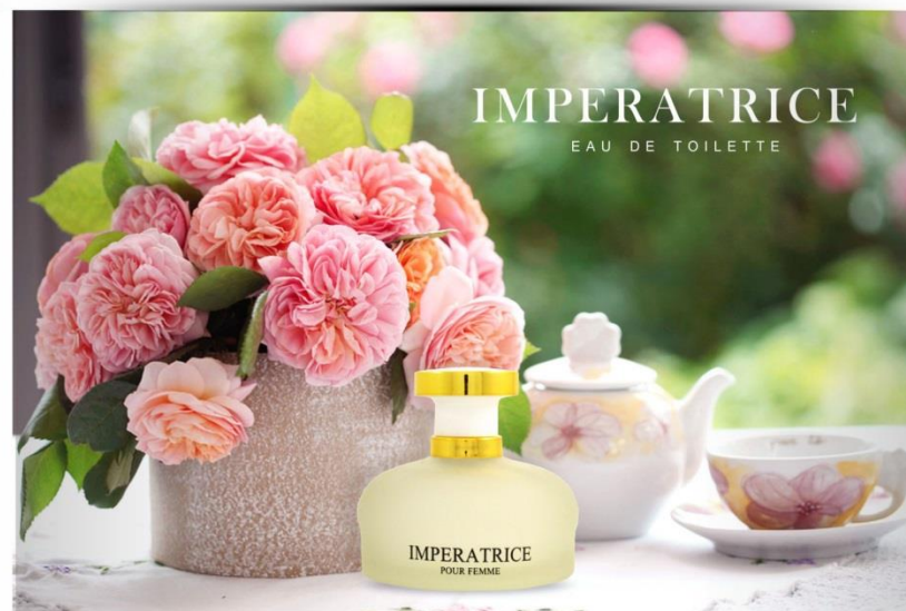
IMPERATRICE №1 жидкая парфюмерная вода 100 ml цветочный, фруктовый