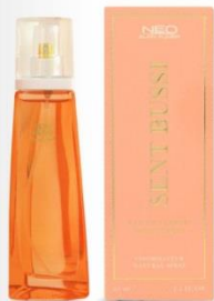
SENT BUSSI жидкая парфюмерная вода 65 ml цветочный, фруктовый