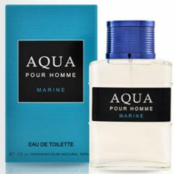
AQUA MARINE мужская парфюмерная вода 100 ml