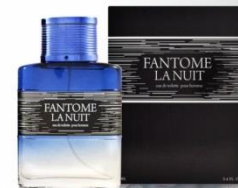
FANTOME LANUIT мужская парфюмерная вода 100 ml