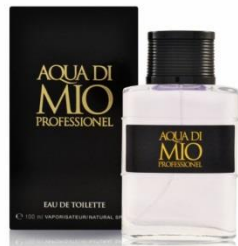
AQUA DI MIO PROFESSIONEL мужская парфюмерная вода 100 ml