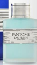
FANTOME EAU FRESH мужская парфюмерная вода 100 ml Сладковатый водный