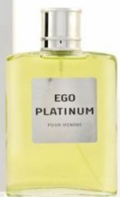
EGO PLATINUM мужская парфюмерная вода 100 ml Сладковатый мускусный