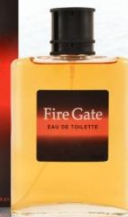
FIRE GATE мужская парфюмерная вода 100 ml Ароматические: Древесный, Мускусный