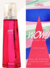
WOW!!! BRITNEY FAN жидкая парфюмерная вода 65 ml цветочный, фруктовый